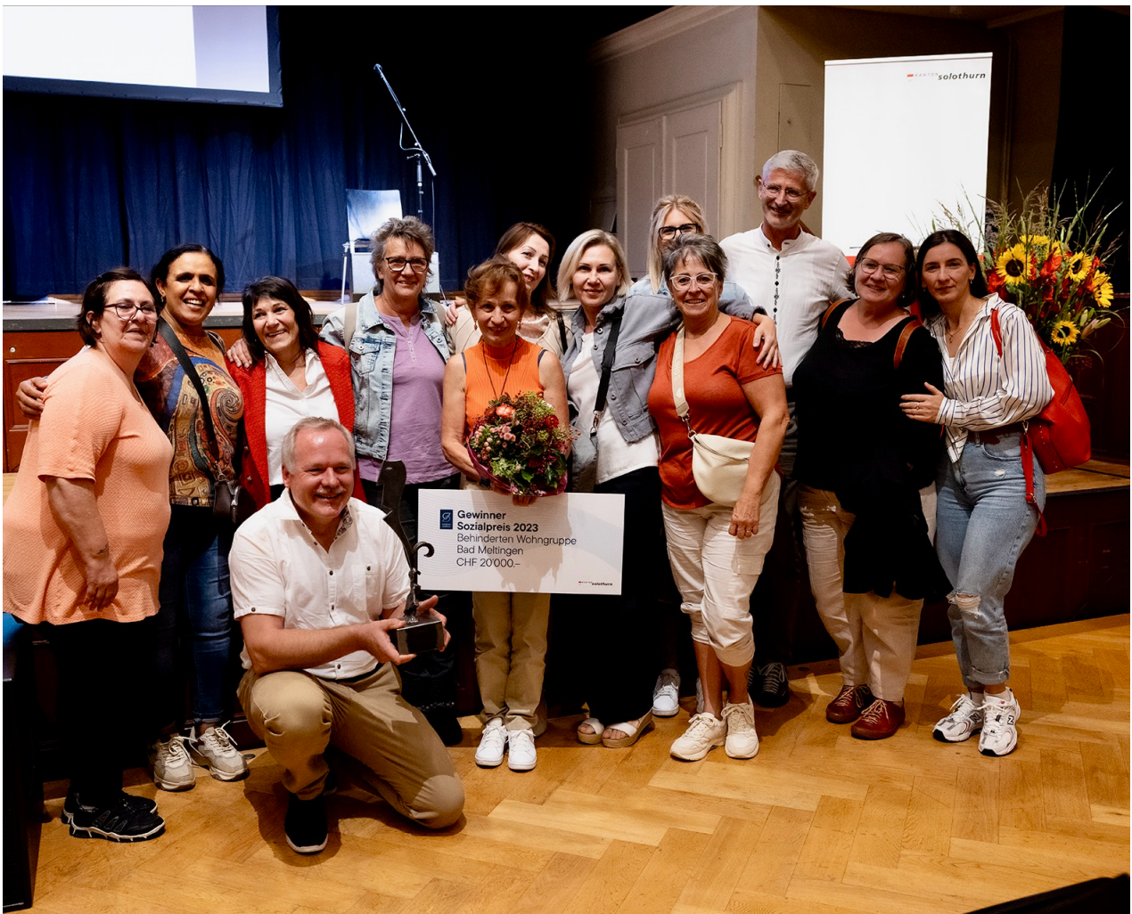
Foto: Verleihung Sozialpreis 2023 des Kantons Solothurn